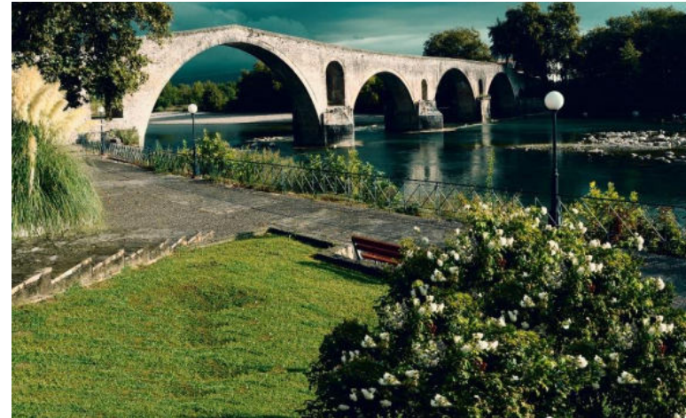
Εικόνα 2- Γεφύρι Άρτας

Όσον αφορά την αναπτυξιακή προοπτική της σημαντικό ρόλο θα παίξει η ολοκλήρωση της μελέτης Οριοθέτησης και Διευθέτησης του Ποταμού Αράχθου στο επόμενο διάστημα, οπότε και θα δοθεί η δυνατότητα στο Δήμο να αναπτυχθεί ένθεν και ένθεν αυτού με μεγάλα αναπτυξιακά έργα γεφυρώσεις, αναπλάσεις παραποτάμιων εκτάσεων και σημαντικά οδικά έργα. Επίσης στόχος είναι η περαιτέρω ενίσχυση του ρόλου της πόλης σε επίπεδο Νομού και σε επίπεδο Περιφέρειας Ηπείρου ως αστικό κέντρο και ως πόλος εκπαίδευσης, έρευνας, καινοτομίας, εμπορίου, τουρισμού και παροχής υπηρεσιών υγείας.