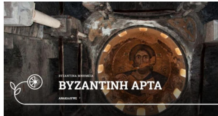
Εικόνα 1

βάθη των αιώνων. Χτισμένη πάνω στα ερείπια της Αρχαίας Αμβρακίας, η οποία χρονολογείται από τον 7ο αιώνα π.Χ., η Άρτα υπήρξε Πρωτεύουσα του Κράτους των Μολοσσών του Βασιλιά Πύρρου. Το 1204 μ.Χ. μετά την Άλωση της Κωνσταντινουπόλεως από τους Φράγκους η Άρτα έγινε Πρωτεύουσα του Δεσποτάτου της Ηπείρου που ίδρυσε ο Μιχαήλ Α΄ Άγγελος Κομνηνός Δούκας.