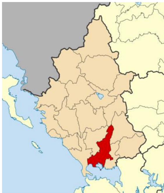
Εικόνα 1- Ο Δήμος Αρταίων στο χάρτη της Ηπείρου

Στο Παράρτημα 1 παρουσιάζονται αναλυτικά στοιχεία σχετικά με την αναπτυξιακή φυσιογνωμία του Δήμου.