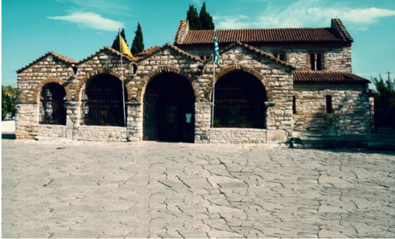
Εικόνα 3- Αγία Θεοδώρα