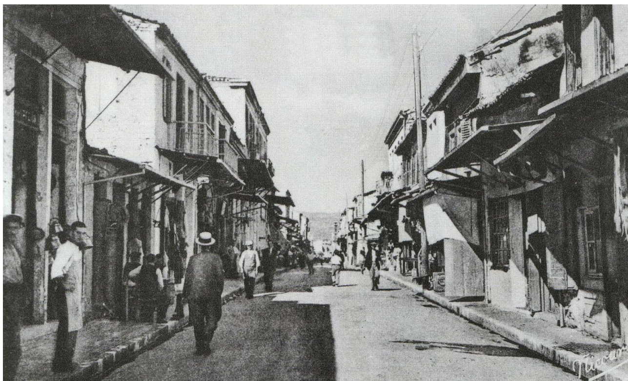
Η οδός Σκουφά κατά τη δεκαετία του 1950

Το κέντρο της Άρτας αποτελούσε ανέκαθεν και το κέντρο της εμπορικής δραστηριότητας της ευρύτερης περιοχής. Η πόλη παρουσιάζει τα τυπικά προβλήματα μιας επαρχιακής πόλης, λόγω της αστυφιλίας σε τοπικό επίπεδο κατά τις δεκαετίες του 50 και του 60. Η άναρχη δόμηση κυριάρχησε και τα αρχιτεκτονικά χαρακτηριστικά της πόλης αλιώθηκαν. Η πόλη έχανε τα ποιοτικά της χαρακτηριστικά. Κατά τη δεκαετία του 1990 έγινε μια προσπάθεια από τις Δημοτικές αρχές να εκτνωθεί το φαινόμενο και να αποδοθεί περισσότερος ελεύθερος χώρος στους πολίτες μέσα από την πεζοδρόμηση μεγάλου μήκους οδών.