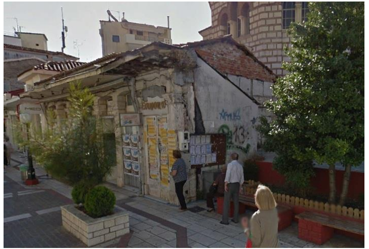
Κιόσκι πληροφόρησης και πώλησης τοπικού χυμού, σε αντίθεση στο κτίριο της φωτογραφίας στεγάζεται το κέντρο τουριστικής πληροφόρησης του Δήμου και γωνία ανακοινώσεων.

Το αρχαίο θέατρο της Αμβρακίας βρίσκεται εγκλωβισμένο εντός ιδιοκτησιών και ανεκμετάλλετου δημόσιου χώρου. Το ίδιο το θέατρο δεν είναι προσβάσιμο από το κοινό, ενώ αρκετές φορές δεν είναι δυνατή και η ίδια η θέασή του. Στην περιοχή δεν υπάρχει επαρκής πληροφόρηση για το μνημείο ούτε και σωστός φωτισμός. Ο δημόσιος χώρος παραμένει αναξιοποίητος λόγω έλλειψης του κατάλληλου αστικού εξοπλισμού.