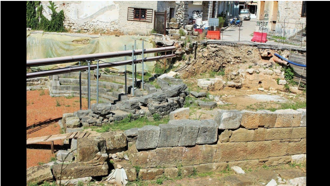
Άποψη στο χώρο του αρχαίου θεάτρου.

Το αρχαίο θέατρο της Αμβρακίας βρίσκεται εγκλωβισμένο εντός ιδιοκτησιών και ανεκμετάλλετου δημόσιου χώρου. Το ίδιο το θέατρο δεν είναι προσβάσιμο από το κοινό, ενώ αρκετές φορές δεν είναι δυνατή και η ίδια η θέασή του. Στην περιοχή δεν υπάρχει επαρκής πληροφόρηση για το μνημείο ούτε και σωστός φωτισμός. Ο δημόσιος χώρος παραμένει αναξιοποίητος λόγω έλλειψης του κατάλληλου αστικού εξοπλισμού.