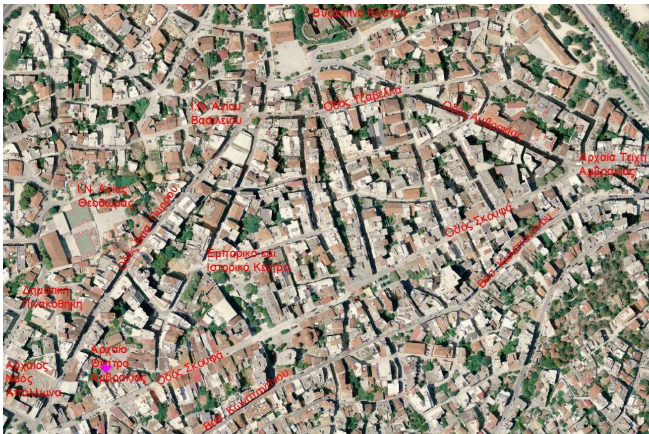
Αεροφωτογραφία που παρουσιάζει την περιοχή παρέμβασης και τη θέση των σημαντικότερων σημείων ενδιαφέροντος εντός της περιοχής.

Εντός της περιοχής παρέμβασης βρίσκονται οι κάθετοι άξονες της οδού Σκουφά προς την οδό Βασιλέως Κωνσταντίνου καθώς και οι οδοί εκείνες οι οποίες αποτελούν συνδετήριες οδοί του εμπορικού κέντρου με τα στοιχεία ενδιαφέροντος , όπως το αρχαίο θέατρο της Αμβρακίας